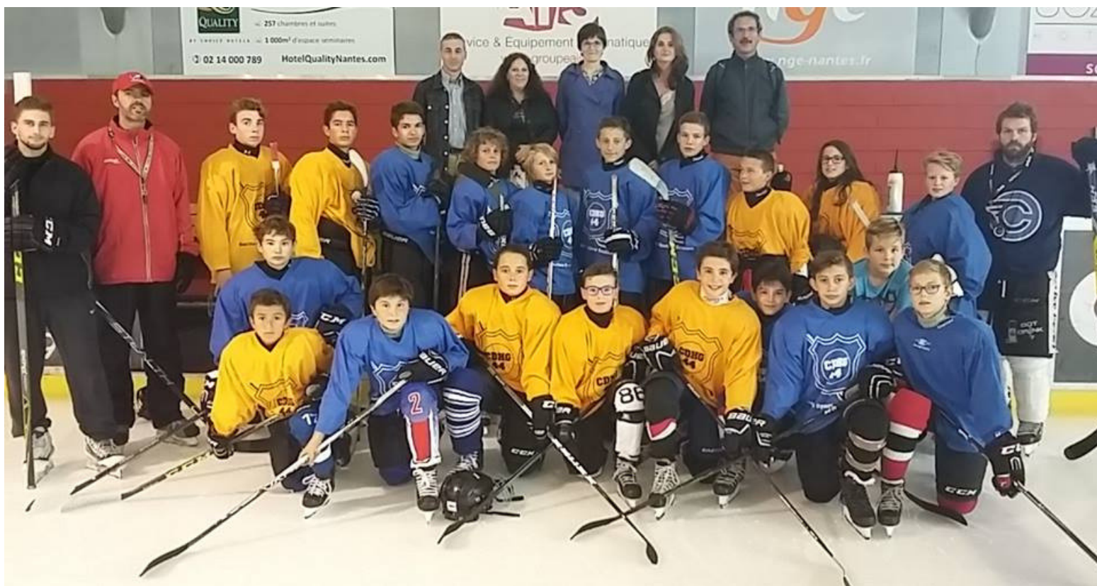
Collégiens de la section sportive scolaire avec leurs entraîneurs et des professeurs

SI TOI AUSSI TU SOUHAITES SUIVRE UN PARCOURS D'EXCELLENCE DANS LE HOCKEY-SUR-GLACE, VIENS PARTICIPER AUX TESTS DE SÉLECTION DE LA SECTION SPORTIVE DU CLUB DE NANTES.